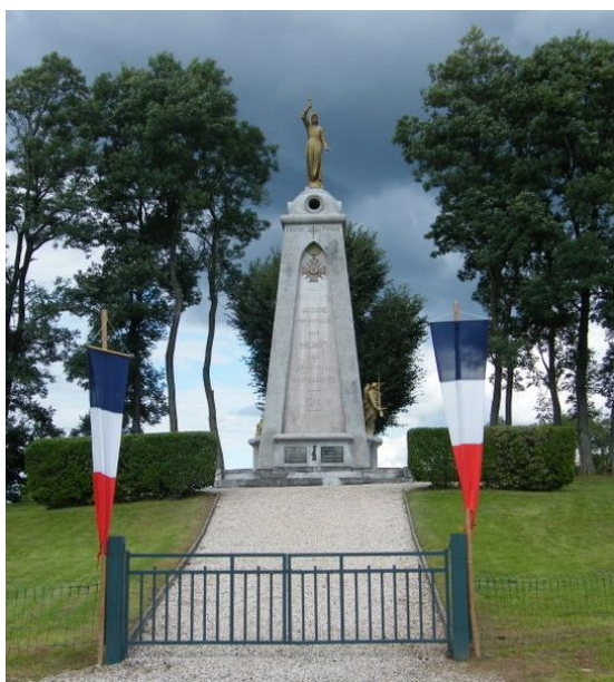
Le « monument des Ubayens » à Ménénil-sur-Belvitte.

Louis Madelin député des Vosges écrit en 1925 : « Pendant ces dix-neuf jours, M. l'abbé Collé, curé de Ménénil, s'était fait la providence de tous. Quiconque a vu, ne fût-ce qu'une seule fois, ce prêtre vigoureux à la figure pleine et énergique, aux yeux de flamme sous les forts sourcils noirs, à la bouche ferme, parfois légèrement ironique, à l'attitude résolue et à la parole prompte, se rend compte du caractère qu'il dut apporter dans les circonstances si critiques, en des heures tragiques ».