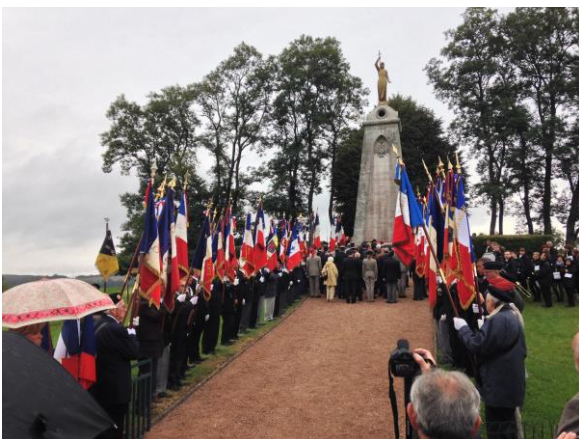
Dépôt de gerbes au mémorial des Ubayens.

Mais avant tout, rappelons l'histoire du calvaire de ce village. Raconter ces dix-neuf jours de combat, décrire l'horreur qu'a vécu votre commune, c'est évoquer ce flux et reflux incessants d'actions offensives, de mouvements de repli suivis aussitôt de tentatives farouches pour reconquérir le terrain perdu.