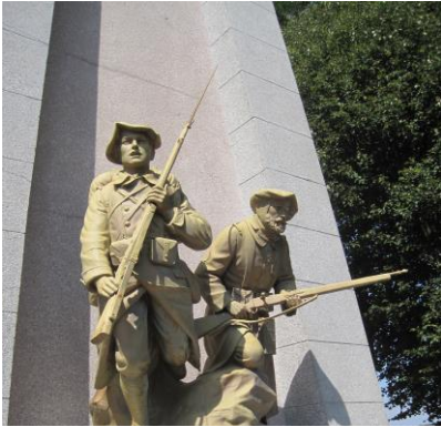
A gauche, un alpin du 157 e RI et à droite un alpin du 97 e RI de Chambéry, s'apprêtant à partir à l'assaut.

Mais déjà, en 1922, une autre idée surgit : il souhaite maintenant élever dans la commune un mémorial à la gloire de l'infanterie alpine. Il achète un bout de terrain sur les hauteurs de Mênil. Il sollicite à nouveau les communes et les associations. En Ubaye, les communes donnent entre 25 et 100 francs. Les grandes communes font de même et lui font des dons importants (entre 1 000 et 2 000 francs parfois). 1 000 francs de 1922 valent 1 101 € en 2012.